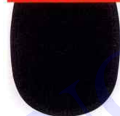
A Mesure réelle 110 x 165 mm