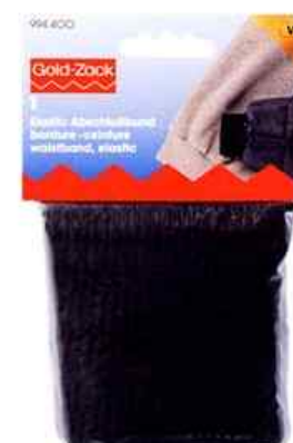
D Mesure réelle 13 x 140 mm