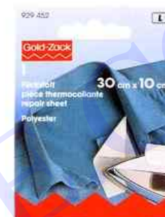
B Mesure réelle 67 x 105 mm