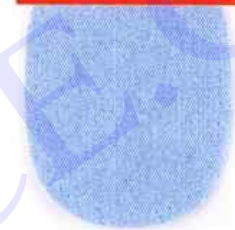
B Mesure réelle 110 x 165 mm