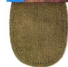
C Mesure réelle 110 x 165 mm