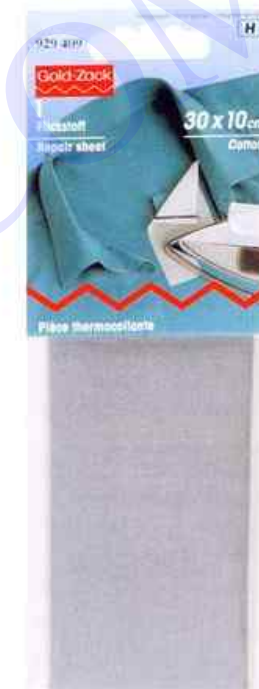
C. Tissus réels: 67 x 185 mm