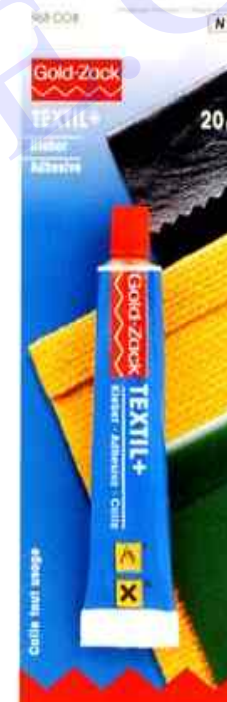
B - Hauteur totale 67 x 103 mm