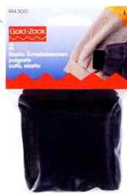
C Mesure réelle 13 x 140 mm