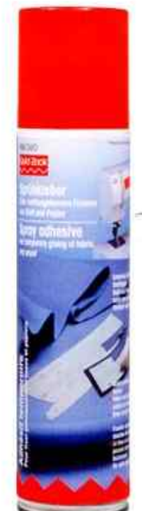
C - Hauteur totale 0 53 x 200 mm