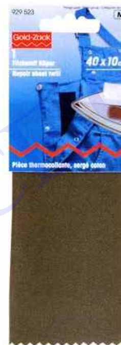
B. Tissus réels: 67 x 185 mm