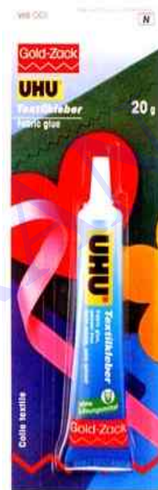
A - Hauteur totale 67 x 103 mm