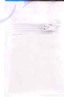
B Mesure réelle 67 x 183 mm