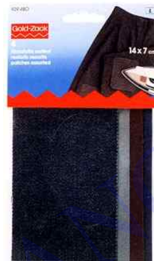
A. Tissus réels: 132 x 185 mm