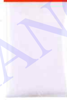
A Mesure réelle 67 x 183 mm